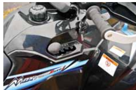
Växellådan innehåller alla kuggar man kan önska sig.