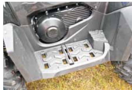
Upphöjningen för passageraren på fotstegen snor lite utrymme för föraren.