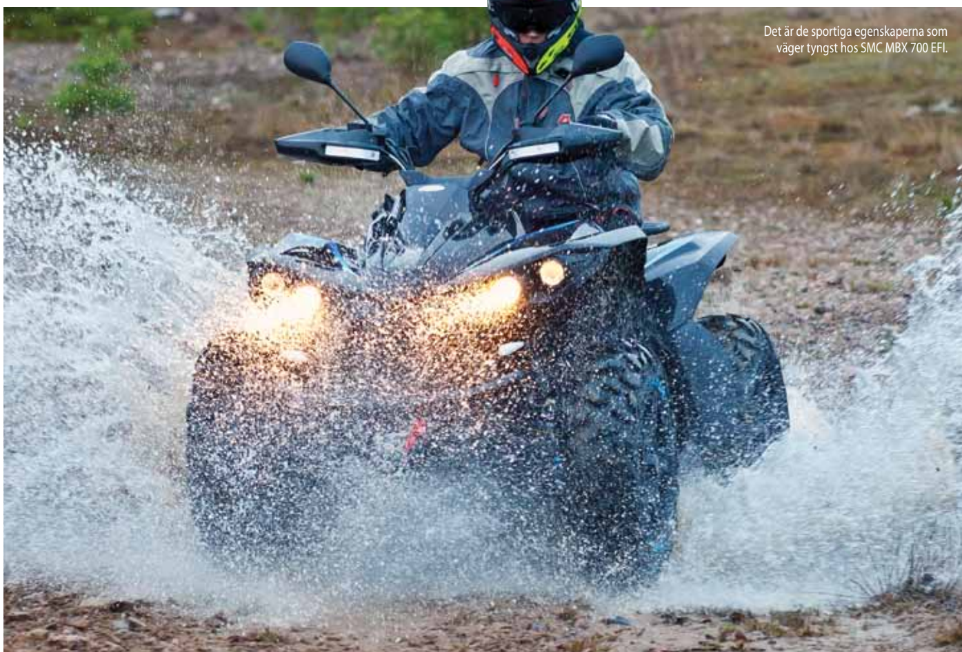
Det är de sportiga egenskaperna som väger tyngst hos SMC MBX 700 EFI.