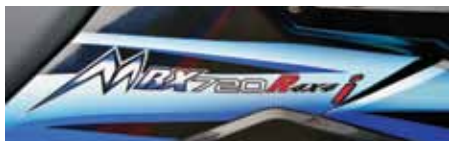
Oavsett vad det står på dekalerna heter den SMC MBX 700 EFI och inget annat.