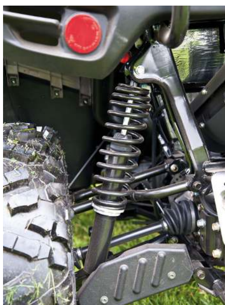
Detsamma gäller dämparna bak och även här sitter det A-armsskydd.