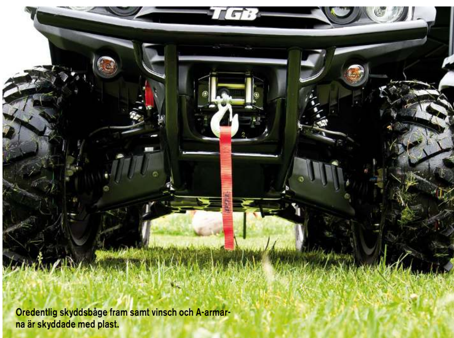
Oredentlig skyddsåge fram samt vinsch och A-armarna är skyddade med plast.