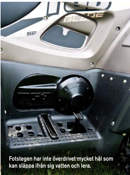
Fotstegen har inte överdrivet mycket håll som kan släppa ifrån sig vatten och lera.