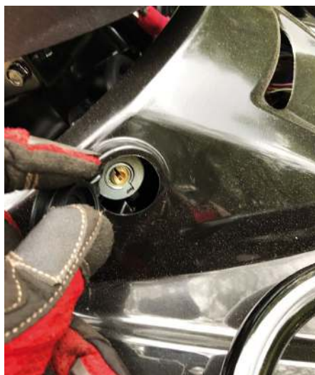
Det är inte på varje fyrhjulig man kan hitta ett lås till styrstängan.