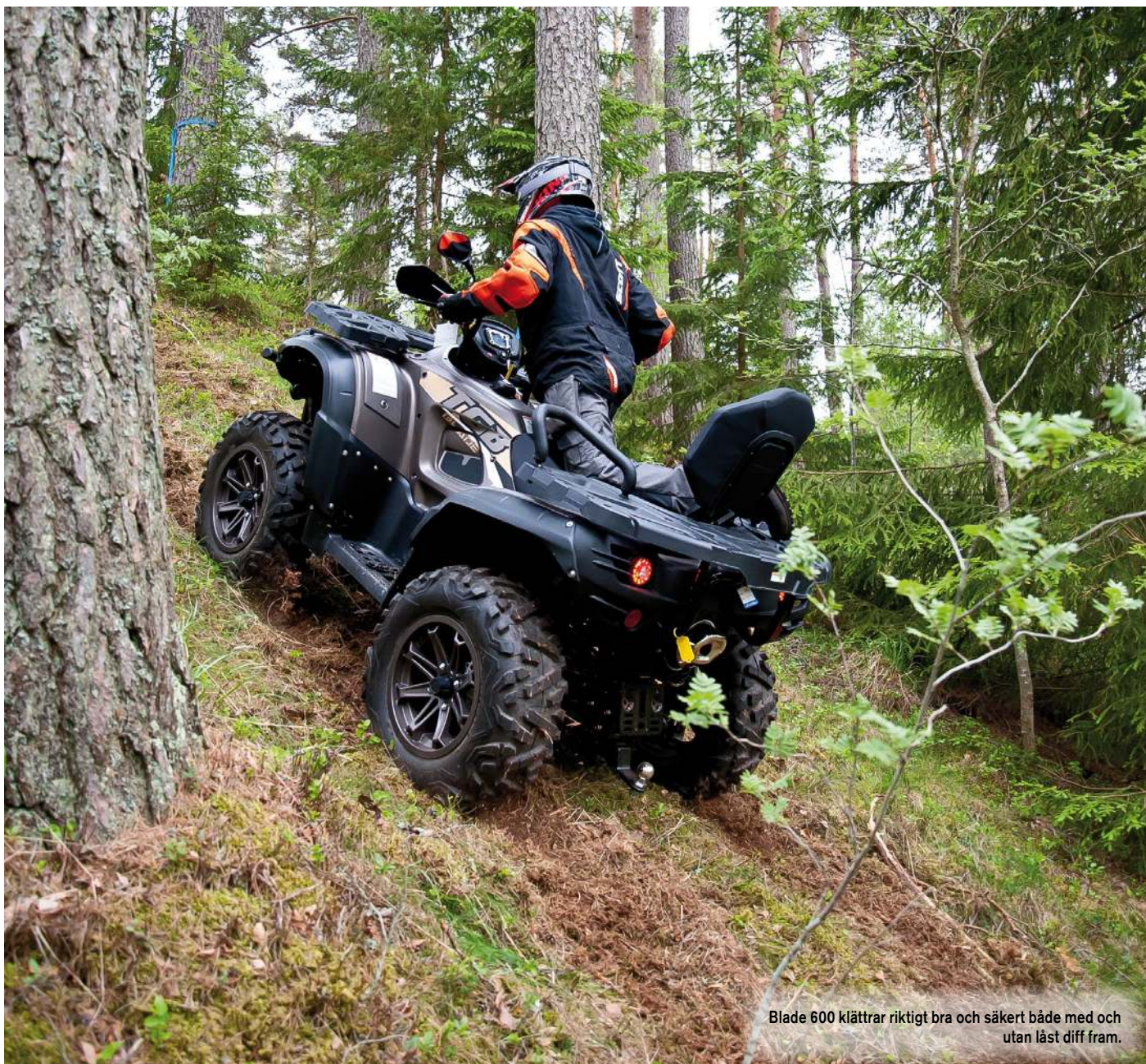
Blade 600 klättrar riktigt bra och säkert både med och utan låst diff fram.

fordon. Nya TGB Blade 600 gör nästan på pricken just 50 km/h, vilket räcker gott och väl för det man bör använda fordonet till, arbete. Av någon anledning har man typat in detta fordon med 19kW vilket motsvarar 25,5 hästar och vi har sett att flera andra tillverkare gör detta på sina traktormodeller, osäkert varför och något vi återkomma till. Här sitter det mesta av denna strypning i gashandtaget i form av en skruv och det är ganska stor skillnad om den sitter där eller inte kan vi avslöja.