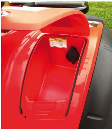
I var framskärm finns det ett förvaringsutrymme där det ena rymmer ett 12V-uttag och båda går att låsa.