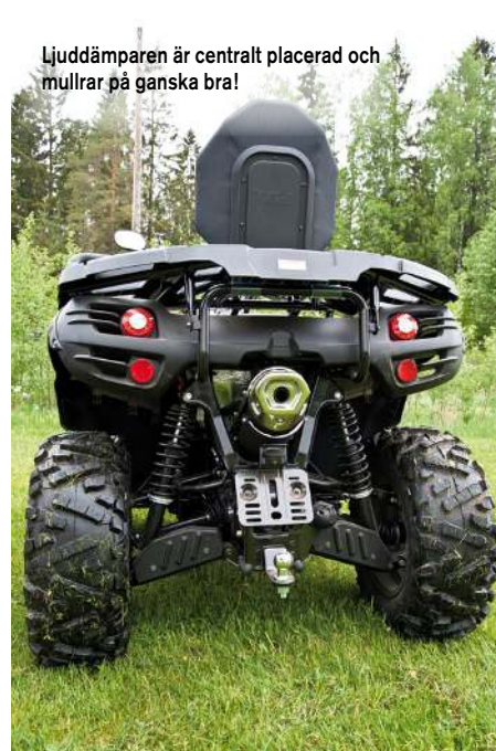
Ljuddämparen är centralt placerad och mullrar på ganska bra!