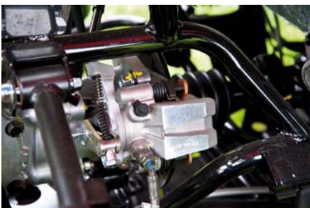
Som Traktor B har den en hydraulisk broms bak istället för två.