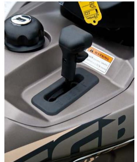
Växellådan har fått ett P-läge och man måste hålla inne en spärr på knoppen för att växla.