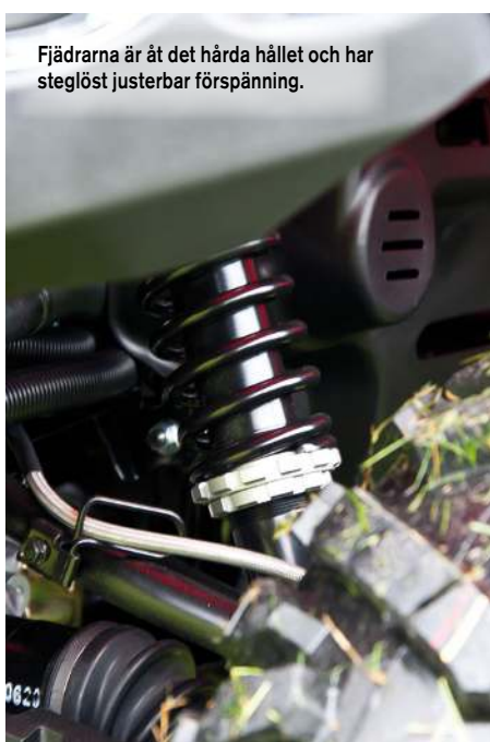
Fjädrarna är åt det hårda hållet och har steglöst justerbar förspänning.