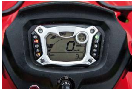
Mycket lätt att manövrera sig runt bland menyerna och ställa in vad som ska visas.