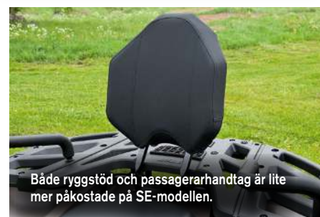
Både ryggstöd och passagerarhandtag är lite mer påkostade på SE-modellen.

Valet mellan en standard eller SE-modell hänger mycket på hur stor plånboken är. Är det bara arbete man ska göra kommer man väldigt långt med standard-modellen, men satsa på den med servo!