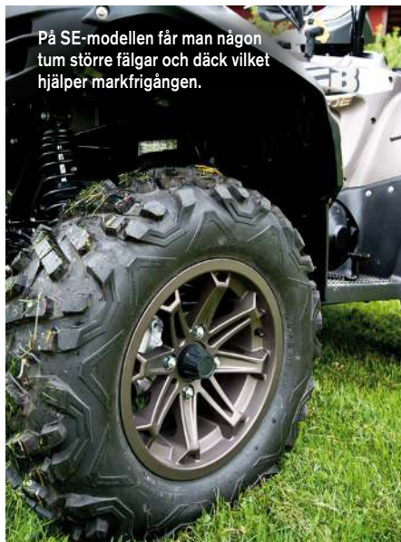
På SE-modellen får man någon tum större fälgar och däck vilket hjälper markfrigången.