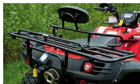
Både när det gäller ryggstödet och lastracken är det ganska stor skillnad på STD- och SE-modellen.