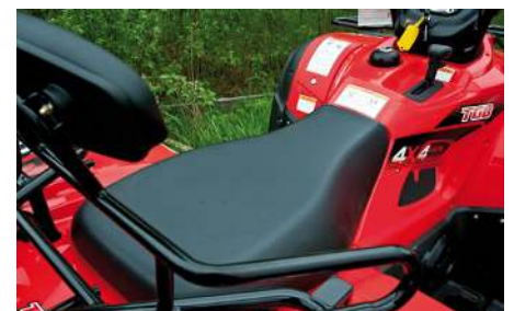
Dynan är hård i sin stoppning och har en väldigt platt utformning.