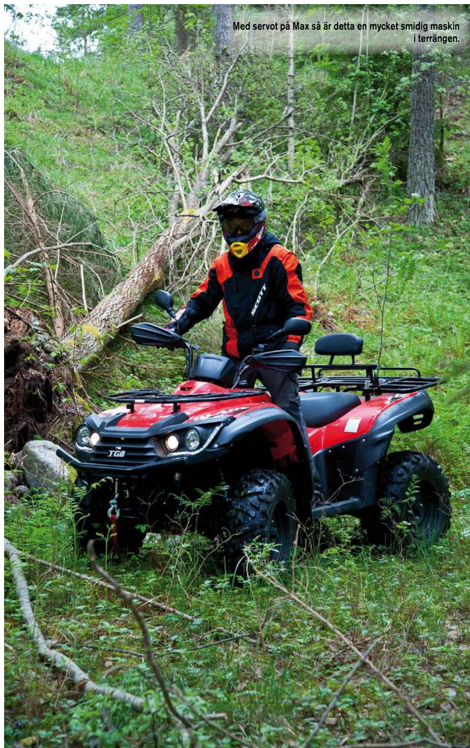
Med servot på Max så är detta en mycket smidig maskin i terrängen.